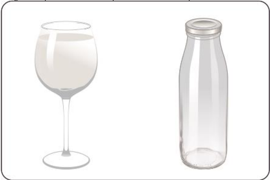
Fig.2. Recipiente recomandate pentru restructurarea apei.

Recomand ca cele două tipuri de recipiente să arate precum cele din figura următoare.